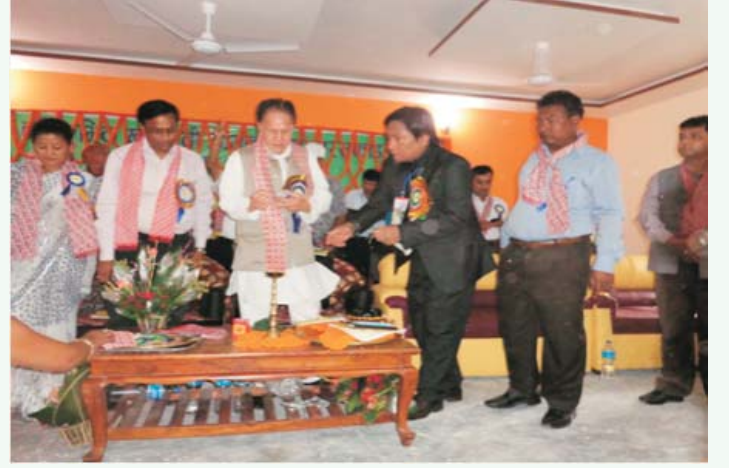
काँकडभिट्टा आयोजनाको शहरी विकास मन्त्रालयका माननीय मन्त्री डा. नारायण खड्काज्यूवाट उद्घाटन

काकडभिट्टा खानेपानी उपभोक्ता तथा सरसफाइ संस्था मेची नगर १० को सुधार विस्तार कार्यक्रम अन्तर्गत दोस्रो साना सहरी खानेपानी तथा सरसफाइ आयोजना (Contract Number STWSSSP/ICB—11/Kakadvitta) को डिजाइन, सुपरीवेक्षण कार्यकालागी BDA छनोट भएको थियो। परामर्शदाता श्री बि.डि.ए. प्लस जेभी काठमाडौंले निर्धारित समयमा आयोजना सम्पन्न गरेकोमा पुरस्कृत भएको छ। काकडभिट्टा खानेपानी उपभोक्ता तथा सरसफाइ संस्था मेची नगरको २०७१/६/२५ मा भएको १९औं वार्षिक साधारण सभाको समारोहमा पाल्नु भएका प्रमुख अतिथि सहरी विकास मन्त्रालयका माननीय मन्त्री डा. नारायण खड्काज्यूवाट BDA ले प्रशंसा पत्र प्राप्त गरेको थियो।