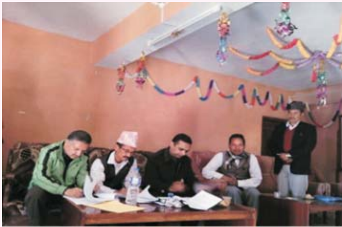
सल्यान नगर आयोजनामा वित्तीय सम्झौता

सुत्केरी भएकी उनको नागरिकता नभएकाले नगरपालिकाको वडा कार्यालयबाट सिफारिस लिन पुगेकी थिइन्। जिल्लालाई २०१६ सम्म खुला दिसामुक्त बनाउने अभियानअन्तर्गत सबैले घरघरमा शौचालय बनाउनुपर्ने र नबनाए सम्पूर्ण सुविधाबाट वञ्चित गरिने निर्णय गरेकाले उनले वडा कार्यालयबाट सुत्केरी भत्ताको सिफारिस पाउन नसकेकी हुन्। नागरिकताको प्रतिलिपि बुझाए मात्र स्वास्थ्य संस्थाले भत्तास्वरूप १ हजार लगायत चार महिना सम्म जाँच गरेबापत ४ सय गरी १ हजार ४ सय दिने व्यवस्था मिलाएको हुँदा बाध्य भएर वडा कार्यालय पुगेकी थिइन्। उनले विवाह भएको केही वर्ष बितिसकदा पनि घरमा श्रीमान् कहिलेकाही मात्र बस्ने गरेकाले अहिलेसम्म नागरिकता बनाउन नसकेको बताइन्।