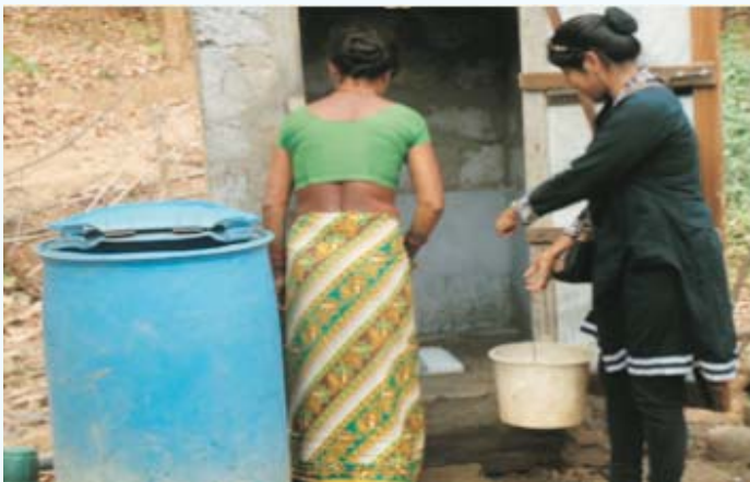
मुकुन्दपुर नगर आयोजना सामाजिक परिचालिकाबाट सरसफाइबारे जनचेतना जगाउँदै

दोस्रो साना शहरी खानेपानी तथा सरसफाइ आयोजना अर्न्तगत कार्यान्वयन भएका २१ नगर आयोजनाहरूमा खानेपानी तथा सरसफाइ संस्था/समितिको प्रतिनिधित्व प्रभावकारी रूपमा भएको पाइएको छ, जसमा करिब ६६ प्रतिशत पुरुष र ३४ प्रतिशत महिलाको प्रतिनिधित्व भएको छ। सबै भन्दा बढी वाग्लुङ्ग तथा आदर्शनगर नगर आयोजनाहरूमा भने क्रमशः ४ (४४.४%) र ५ (५५.६%) जना महिलाहरूको प्रतिनिधित्व रहेको छ, जुन उत्साहवर्दक देखिन्छ। अधिकांश नगर आयोजनाहरूमा खानेपानी तथा सरसफाइ समितिको कुनै एक कार्यकारी पदहरू (उपाध्यक्ष, सचिव र कोषाध्यक्ष) मा महिला कार्यरत रहेको पाइएको छ। यसैगरी आयोजना व्यवस्थापन कार्यालयबाट आयोजना कार्यान्वयन सहयोग इकाई कार्यालयमा २१ जना सामाजिक परिचालिकाहरू परिचालित भइ कार्यरत रहेका छन्।