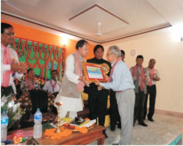
आयोजना निर्धारित समयमा सम्पन्न भएकोमा बि.डि.ए.प्लस जेभी पुरस्कृत