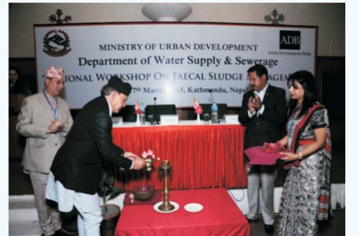
दिसाजन्य लेदो व्यवस्थापन सम्बन्धी राष्ट्रिय कार्यशाला गोष्ठीको उद्घाटन गर्दै माननीय मन्त्री डा. नारायण खड्काज्यु