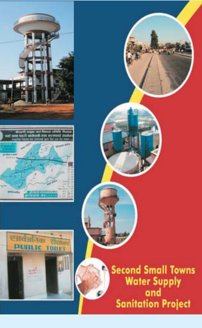
Second Small Towns Water Supply and Sanitation Project

नेपालमा एशियाली विकास बैंकको अनुदान सहयोगमा संचालित दोस्रो साना शहरी खानेपानी तथा सरसफाइ आयोजना