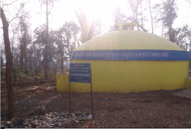
बाबियाचौर तेश्रो साना सहरी खानेपानी तथा सरसफाइ आयोजना, सुर्खेत