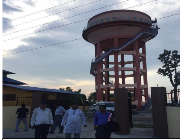
महेन्द्रनगर तेश्रो साना सहरी खानेपानी तथा सरसफाइ आयोजना.सनसरी